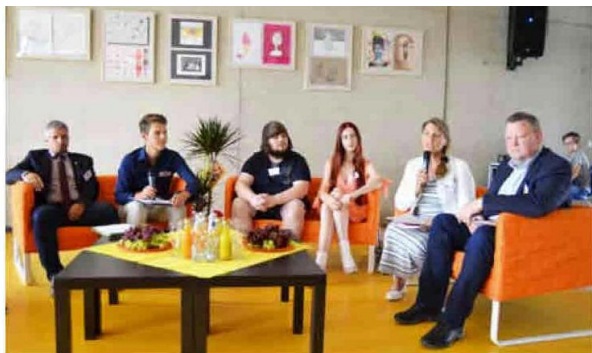
Bei der Podiumsdiskussion kam auch das Thema Lehrermangel zur Sprache.

Le lycée privé, FGG , a célébré ses 10 ans d'existence, années que la directrice a qualifiées d' « aventure à l'issue positive ». ↓