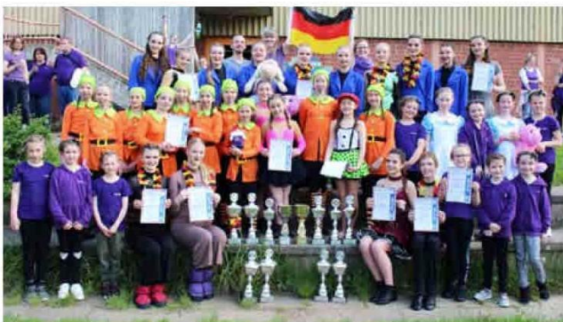
Die frisch gekürten Deutschen Meister und Vizemeister aller Altersklassen der Tanzgruppe Mücheln.