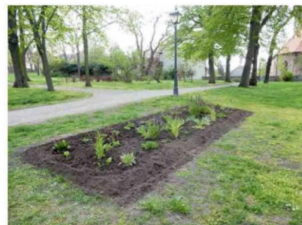
Das Staudenbeet im Park wird Heimat von Bienen, Schmetterlingen und Co.

C'est pourquoi une Initiative de citoyens « Natürlich Mücheln » ↑ a vu le jour pour s'occuper de créer des parterres et prairies, dans des espaces publics, avec des plantes respectueuses des abeilles.