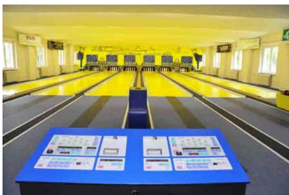
Die sanierte Kegelbahn ist technisch auf dem neuesten Stand.

← La piste de bowling pour l'association de bowling a été entièrement renouvelée et les sportifs espèrent remonter en ligue 1.